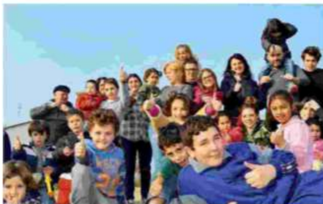
Giornata di festa al Villaggio della Gioia

Il Villaggio della Gioia è un luogo unico e pionieristico in Italia, uno degli ultimi che don Oreste Benzi ha voluto realizzare in prima persona nel cuore della sua